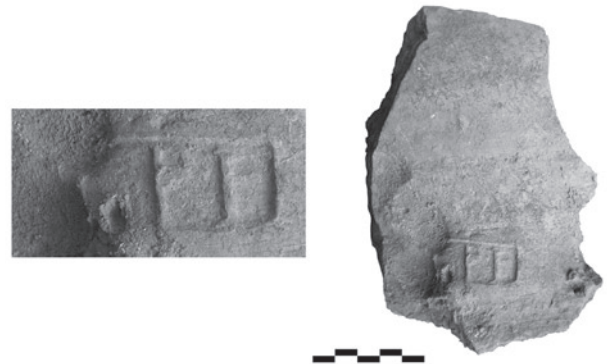
Обр. 2. Conbustica. Находки от ранноримския пласт. Обр. 3. Conbustica. Фрагмент от тухла с печат на Leg(ionis) VII C(laudiae) p(iae) f(idelis) .

36-37, Т. 55-56). Сред находките от Conbustica част от тази керамика е покрита с черен лак (обр. 2/10, 15 – 17).